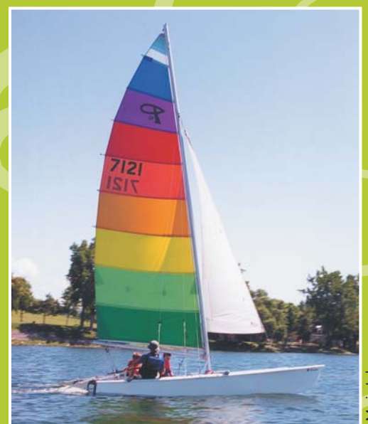
Centre nautique de Châteauguay.