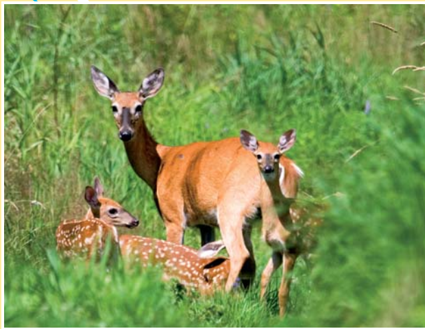
Cerfs de Virginie

Parc Léveillé (Location de canots, kayaks et pédalos) (450) 699-1781